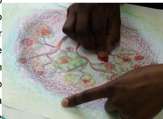
Fotografia 2: Professora aprendendo desenho com giz de cera no projeto Dom da Palavra, em Embu Guaçu - SP

O desenho com giz de cera é muito usado nas primeiras séries do ensino fundamental. A criança aprende a desenhar preenchendo a página toda com cores, e procura-se estimular o desenho sem contornos, pois, na realidade, estes não existem. Não vemos o contorno de uma pessoa ou objeto, vemos cores que se encontram em planos justapostos.